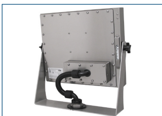
Monitor mit Universalhalterung an Industrie-U-Halterung mit KVM-Extender.