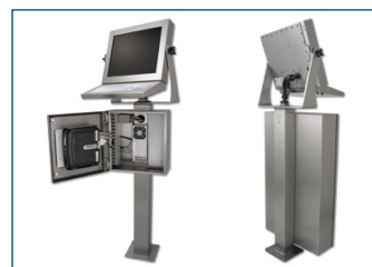
Komplette Arbeitsplatzkonfiguration mit PC-Gehäuse, Tastatur, U-Halterung und Sockel.