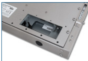
Öffnung für interne Anschlüsse