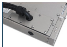
Kabelausleitungen für Kabelkanal (IP65/IP66)