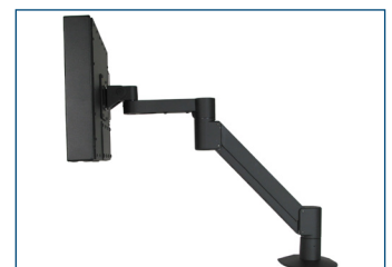
Universalmonitor montiert auf VESA-Radialarm.