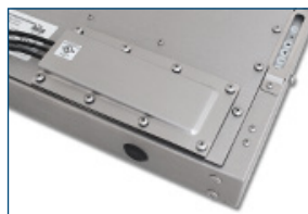
Stopfbuchse (IP22 oder IP65/IP66)