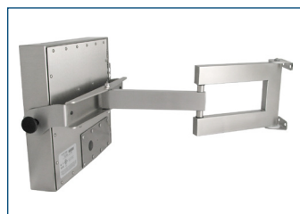
Monitor mit Universalhalterung montiert auf einer schweren industriellen Armhalterung der Schutzklasse IP65/IP66