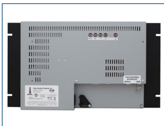
Rückansicht des 15" Rackmonitors.