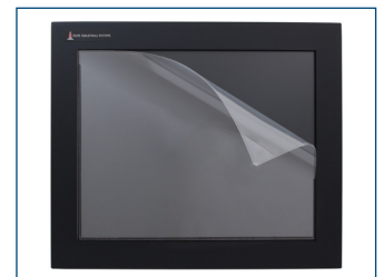
Der optionale Displayschutz schützt Touchscreens vor Kratzern und Abnutzung.