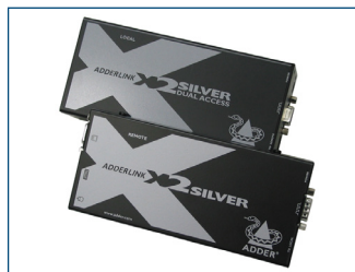
Der optionale KVM-Extender ermöglicht es, den Monitor bis zu 300m entfernt vom Computer zu platzieren.